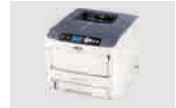
OKI PRO6410 NEON MAX: A4XL