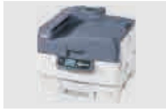
OKI PRO920WT ES9420WT/C920WT MAX: DIN A3XL