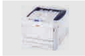
OKI PRO8432WT MAX: DIN A3XL