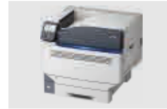
OKI PRO9541WT MAX: DIN A3XL